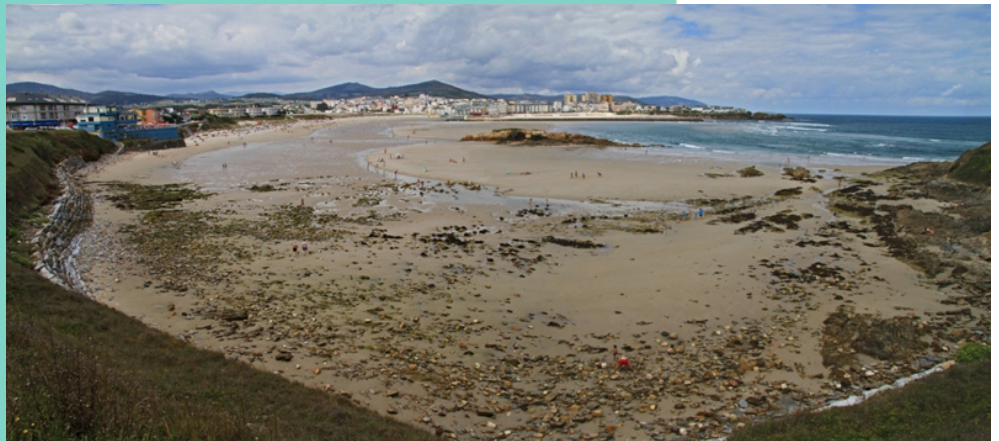
Praia do Altar