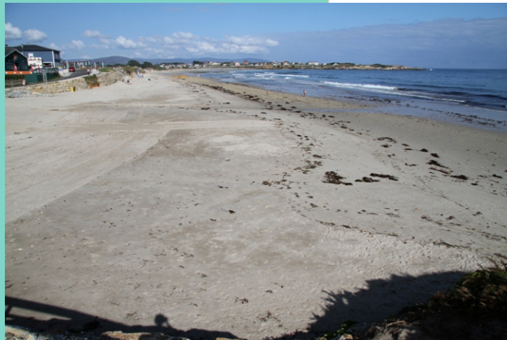
Praia de Reinante (formada polos areais de Moledo, Reinante e Arealonga)