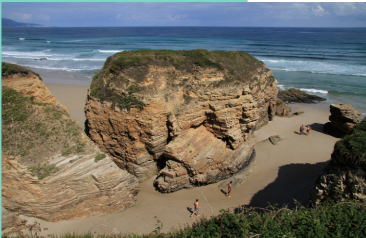
Praia da Fontela.