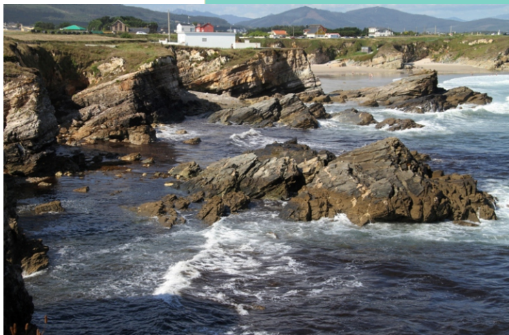
Punta do Castro.