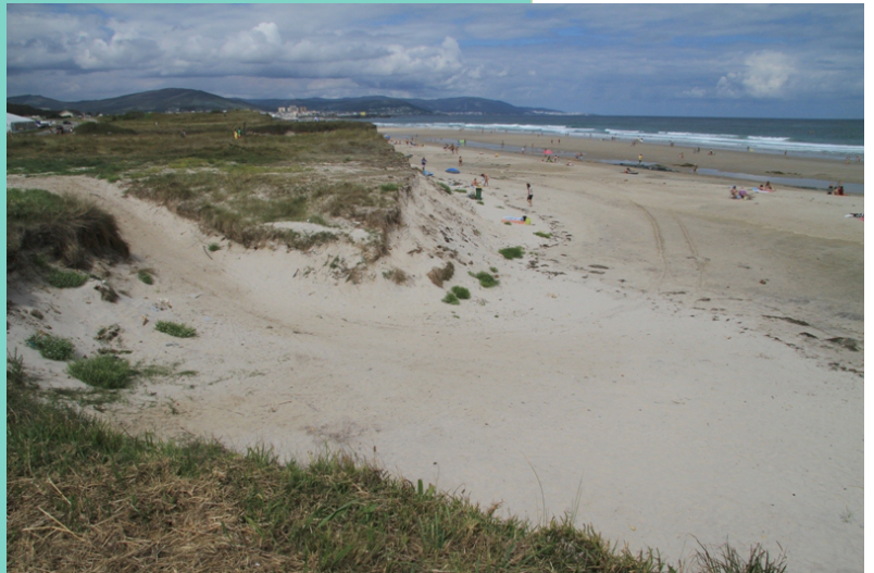
Praia do Coto ou de San Cosme, un dos poucos areais nos que se conservan as dunas.