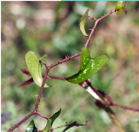
Silva do mar ( Smilax aspera )