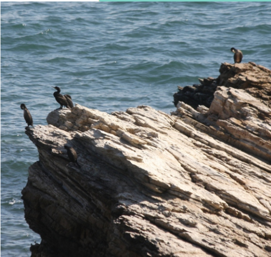
Corvos mariños cristados