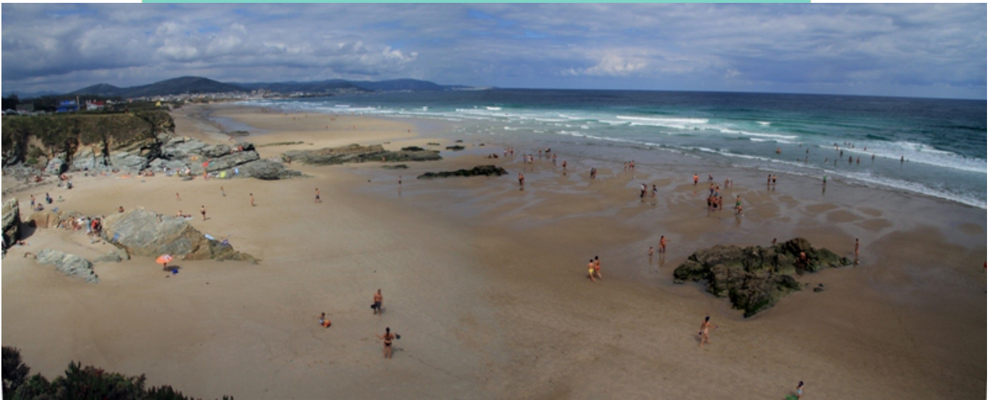
Praia de San Cosme