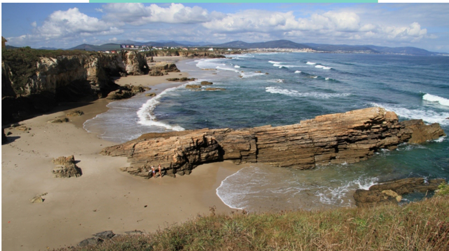
Praia de Lóngara, un interesante museo xeolóxico onde podemos atopar furnas, arcos e pregues.